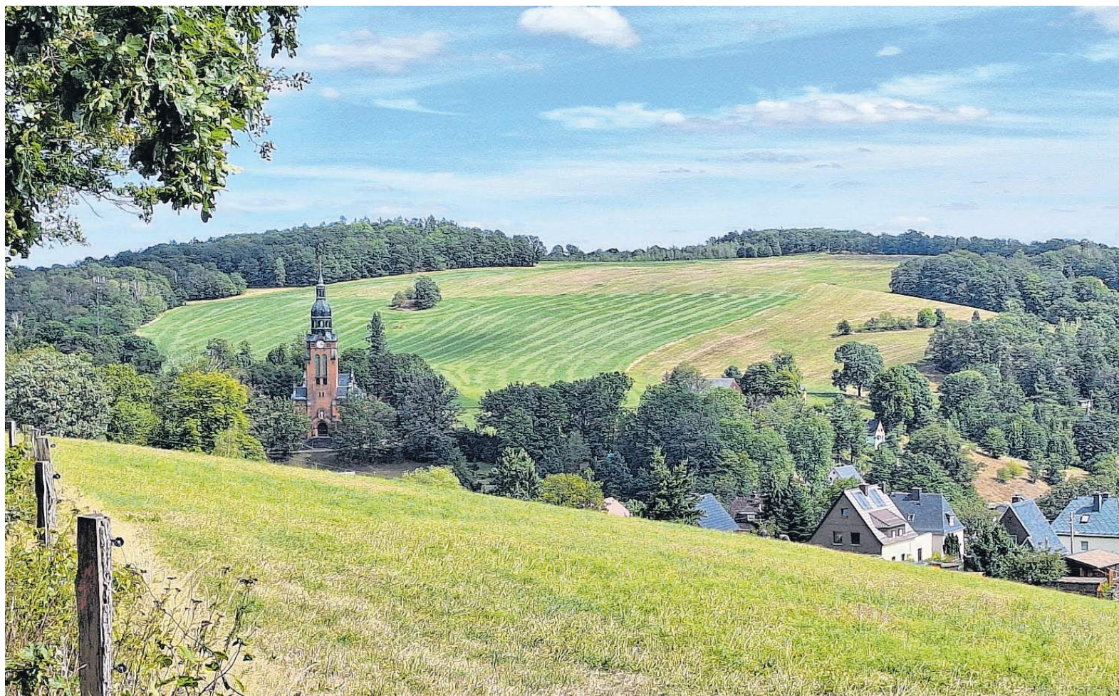
Bevor die Wanderer final nach Harthau absteigen, haben sie einen schönen Blick in den Stadtteil. Die wichtige Lutherkirche dominiert das Tal.

Kennzeichnung und Orientierung: Der grüne Kreis und das Logo mit einem vierfarbigen Schmetterling vor zwei Bergen begleitet die Wanderer auf der ganzen Strecke. Darüber hinaus gibt es die üblichen Schilder mit der Aufschrift „Wanderweg Adelsberg-Harthau“. Die Tour ist gut gekennzeichnet. Ein Schild mehr würde man sich gleich im Anschluss an die Kirche Adelsberg oder nach dem Zusammenfluss von Zwönitz und Würschnitz zur Chemnitz wünschen. Am Schusterberg/Steinberg führt der offizielle Weg durch ein Maisfeld Richtung ehemaliges Bad Erfenschlag. Das muss man der Kennzeichnung richtig entnehmen. Im Internet kann man sich zusätz-