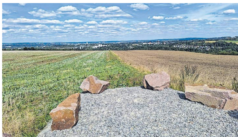
Auf dem Pfarrhübel soll einer der vier Aussichtspilze zum Unterstellen, Rasten und Schauen entstehen. Hier hat wohl jeder gebürtige Karl-Marx-Städter beim Schulwandertag einst schon gestanden.

lich die Strecke als PDF bzw. im Format für die Navigationsapp Komoot herunterladen.